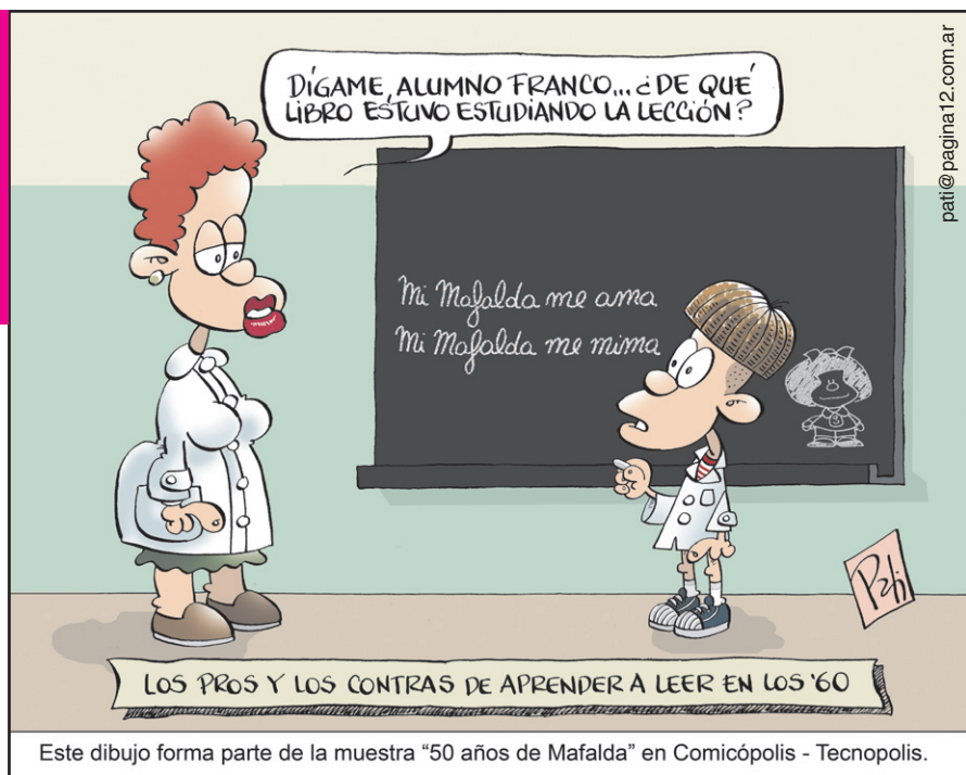
Este dibujo forma parte de la muestra "50 años de Mafalda" en ComiCópolis - Tecnópolis.